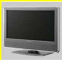
20型地デジ液晶テレビ (テレビカード式では ありません)